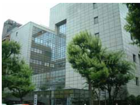
東京都教職員互助会三楽病院

教育庁は、三楽病院を運営する東京都教職員互助会に病院の運営費補助金を交付している。ところで、三楽病院が神奈川県葉山町に所有する土地（661.65㎡）は、病院職員の厚生施設用地であったが、昭和51年に老朽化のため施設を解体した。