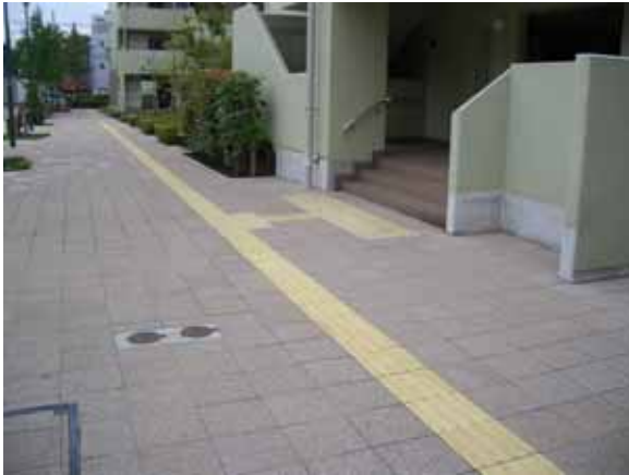
視覚障害者誘導用ブロック

東京都福祉のまちづくり条例においては、「高齢者、障害者が円滑に利用できるように配慮された住宅の供給に努めなければならない」とされており、これを具体的に実現する同条例整備基準への適合努力義務が事業者に課せられている。