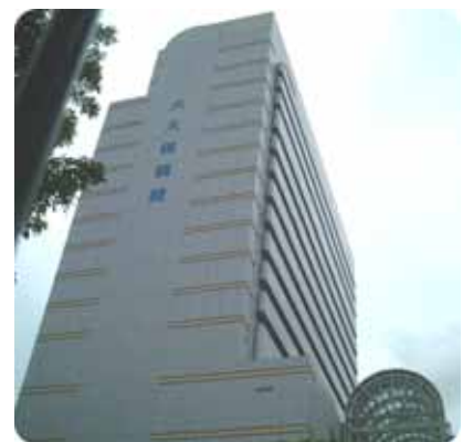
東京都保健医療公社大久保病院

局は、運営費補助金の交付決定及び額の確定を交付要綱に基づいて行い、補助事業の効率的かつ効果的な執行に資するようにされたい。