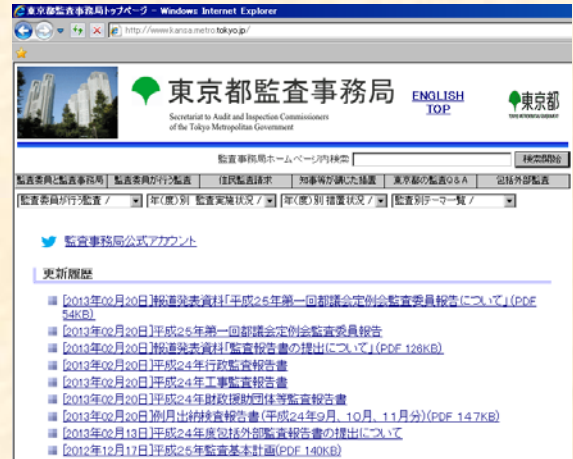
監査事務局ウェブサイト

また、監査事務局ウェブサイトでも各種監査報告書や監査の結果に基づいて知事等が講じた改善措置等の全文（PDFファイル）を掲載しています。ぜひ、ご覧ください。