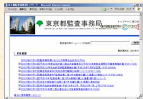
監査事務局ホームページ

http://www.kansa.metro.tokyo.jp/index.html