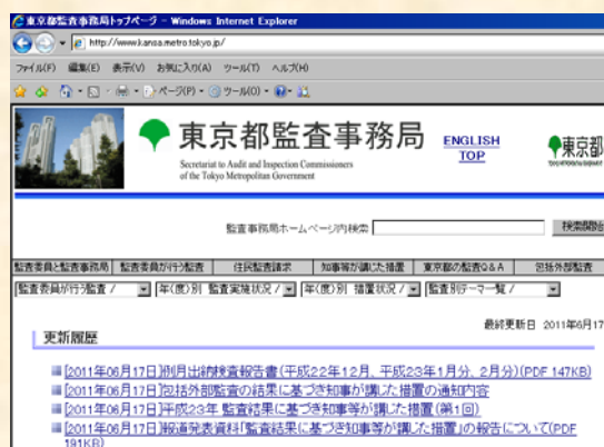
監査事務局ホームページ

http://www.kansa.metro.tokyo.jp/index.html